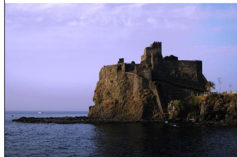
Castello Normanno di Aci