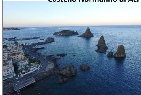
Faraglioni Aci Trezza