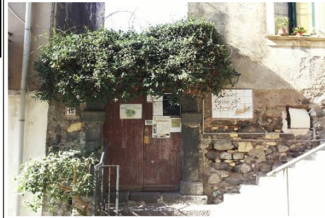
La Casa del Nespolo

Tel.+39 095 0923572-+39 347-6868900 -Mail: prolocoacicastello@tiscali.it